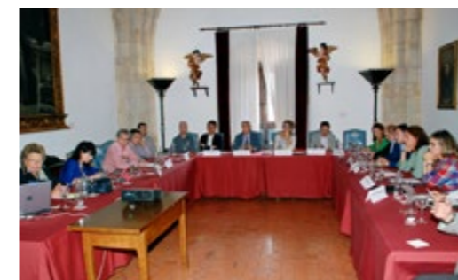
XIV Reunión Multidisciplinar de Expertos

Así, en la reunión volvió a ponerse de manifiesto la importancia de la formación en el manejo del dolor que, a partir de ahora, habrá de incluir también una inmersión en los avances tecnológicos relacionados con la especialidad.